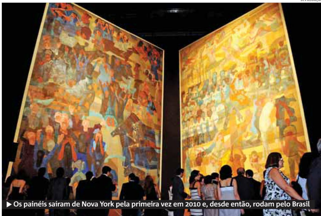
► Os painéis saíram de Nova York pela primeira vez em 2010 e, desde então, rodam pelo Brasil